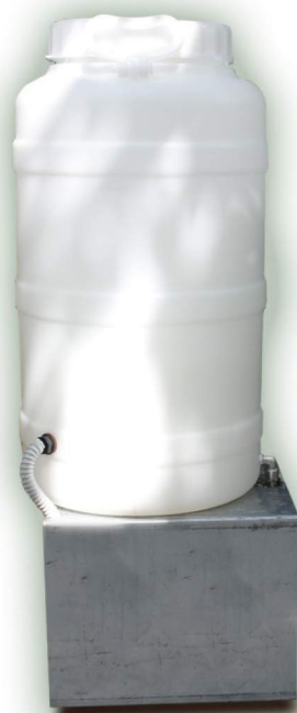
BASE IN ACCIAIO